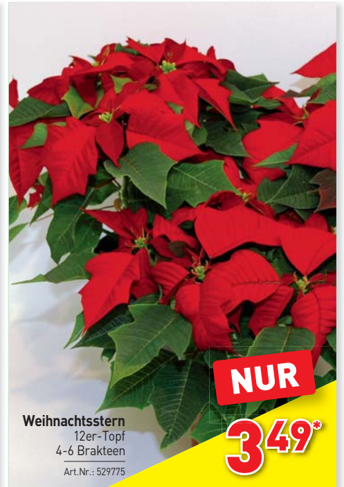
Weihnachtsstern 12er-Topf 4-6 Brakteen Art.Nr.: 529775