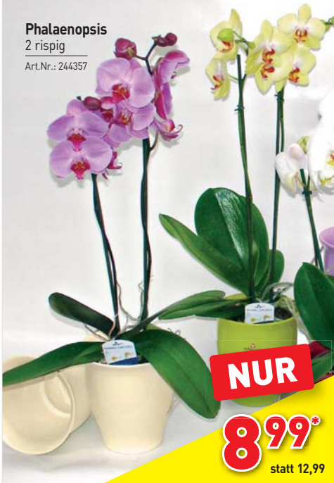
Phalaenopsis 2 rispig Art.Nr.: 244357

BESUCHEN SIE UNSEREN GROSSEN WEIHNACHTSMARKT