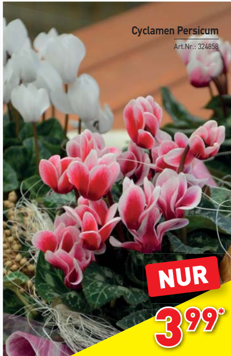
Cyclamen Persicum Art.Nr.: 324858